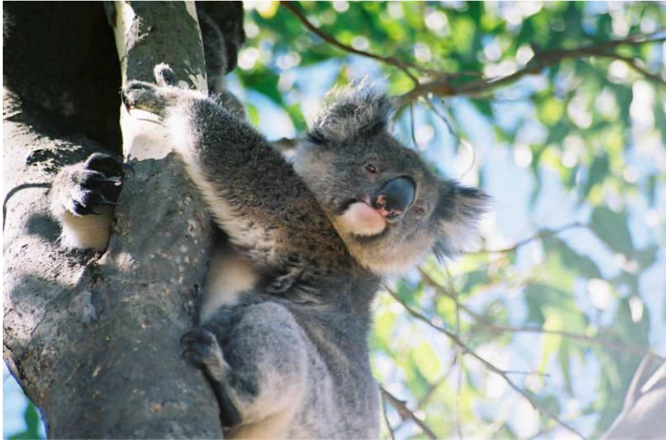
un koala, qui passe la plus grande partie de sa vie sur un eucalyptus